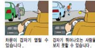
차문이 갑자기 열릴 수 있습니다. 갑자기 뛰어나오는 사람을 보지 못할 수 있습니다.

(5) 정차해 있는 차의 옆을 지날 경우, 갑자기 문이 열리거나 차에 가려 갑자기 뛰어나오는 사람을 보지 못하는 경우가 있으므로 주의합니다.