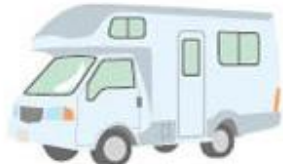
キャンピングカー