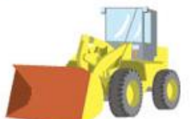
ショベルローダー