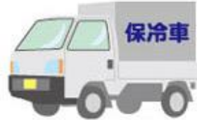
軽トラック（保冷車）

（3）車両重量が3,000kgを超え、または最大積載量が2,000kgを超える大型バス（マイクロを含みます。）、大型トラック（大型トレーラーを含みます。）についても、燃料補給、ドアロック開錠作業に限りロードサービスをご利用いただけます。